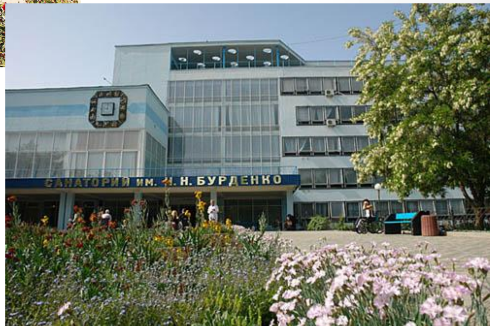
Специализированный спинальный санаторий имени академика Н. Н. Бурденко