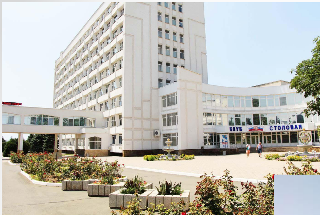
Сакский военный клинический санаторий им. Н.И. Пирогова МО РФ