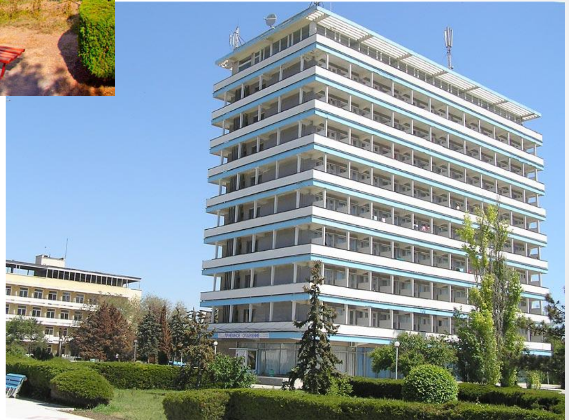
Санаторий «Таврия», г.Евпатория