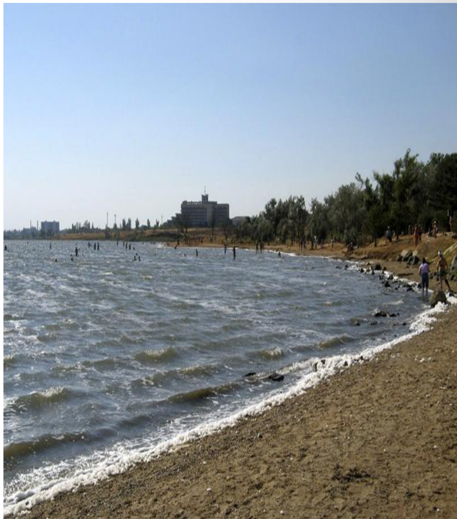
Сакское соленое озеро, г.Саки