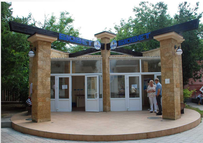
Бювет минеральной воды в г.Евпатория