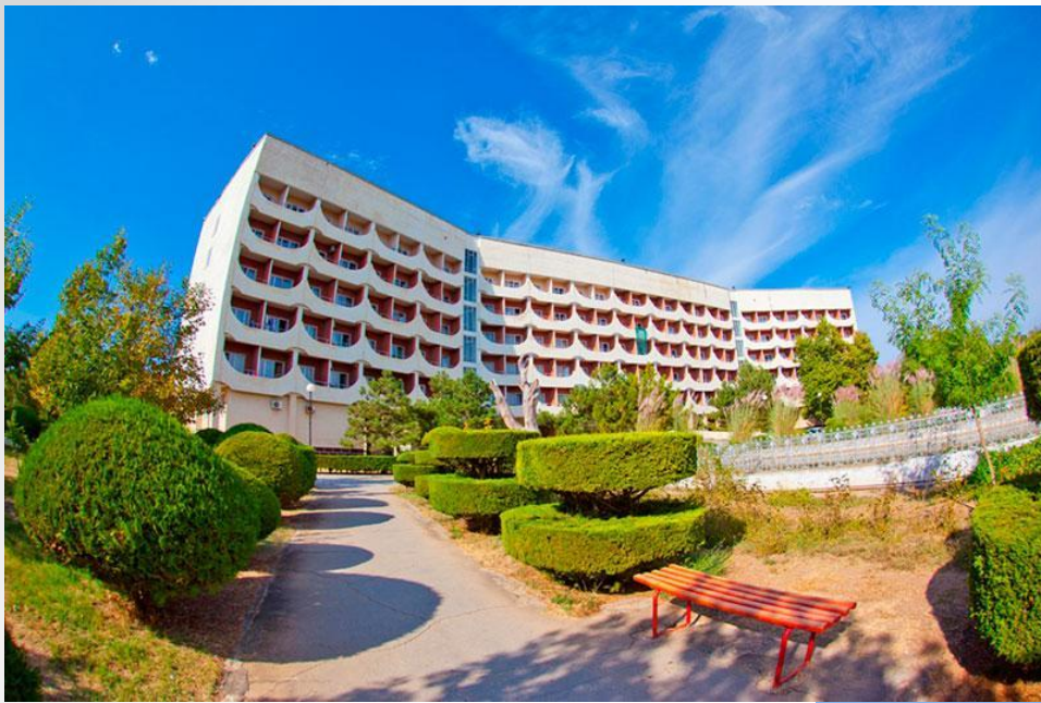
Клинический санаторий "Приморье" для детей с родителями, г.Евпатория