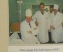
Офис проф. В.В. Рыбинина в ОПИТ