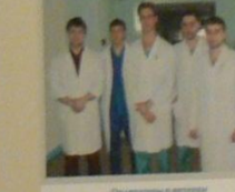
Фельдшеры в операционной кабинете лапароскопического лечения