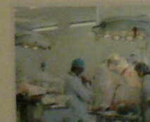
Нurse ассистент операционной