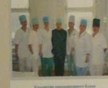
Коллектив операционного блока