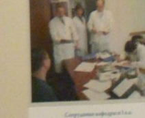
Секретари операционного кабинета