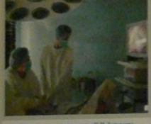
Док. старшего специалиста М.В. Завьялова выполняет лапароскопическое лечение