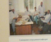
Секретари операционного кабинета