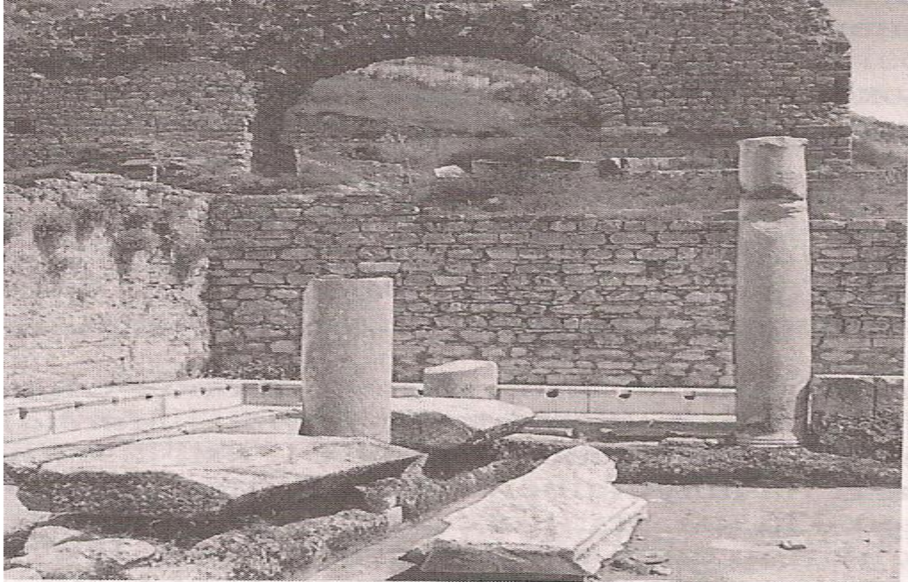
Рис. 72. Латрина (лат. latrina ) — общественный туалет периода Римской империи. Эфес (территория Турции)