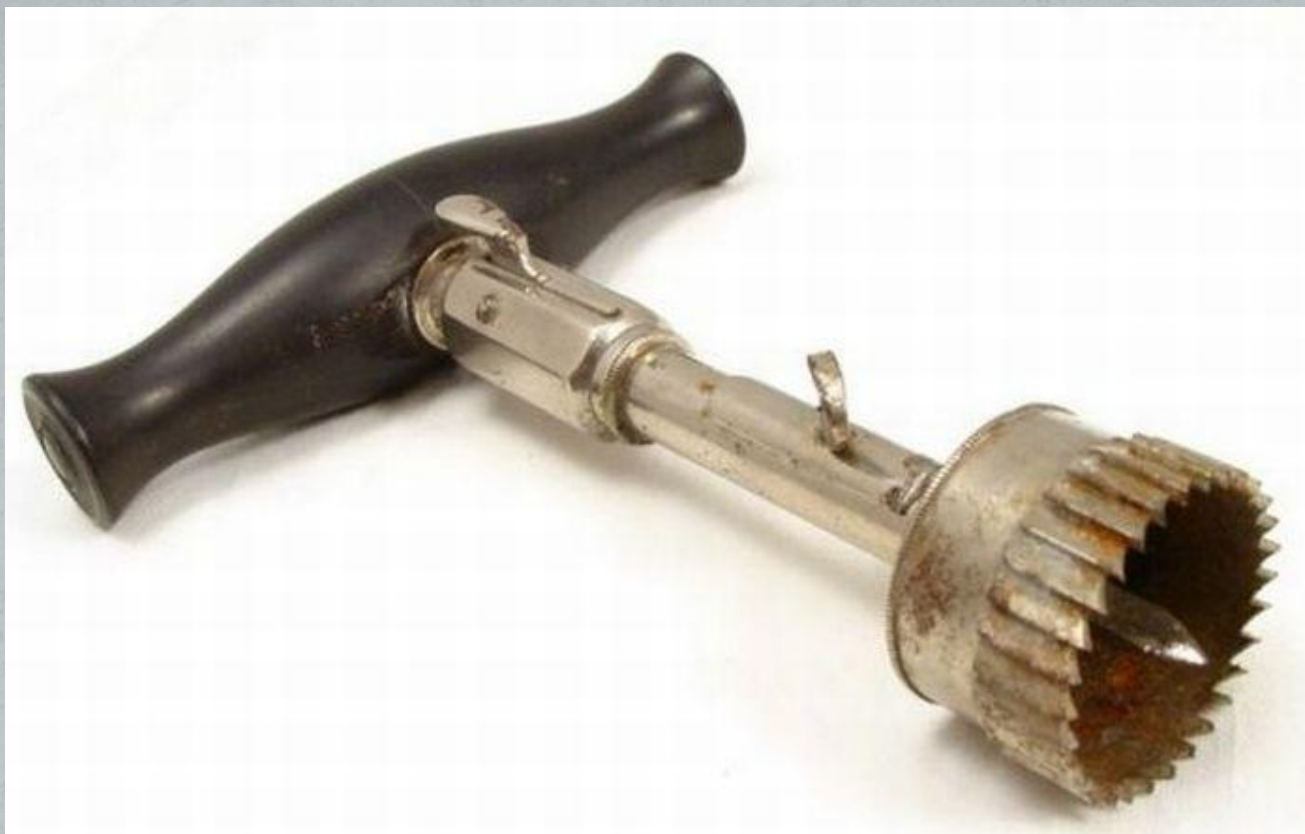
Прибор для вскрытия черепной коробки (XIX век)