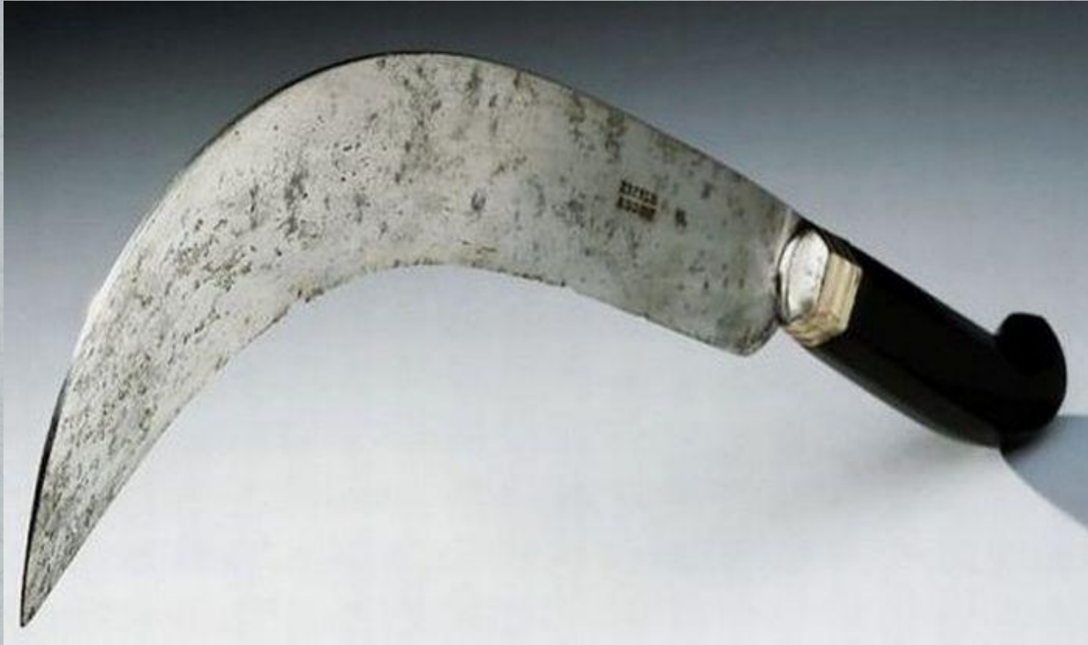
Нож для ампутаций (XVIII в.)