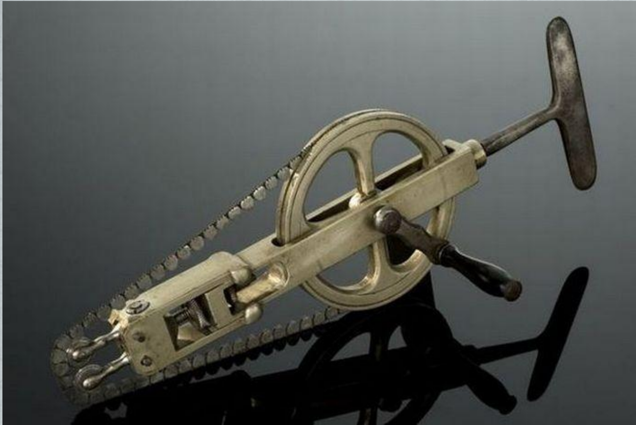
Пила для черепа (XIX в.)