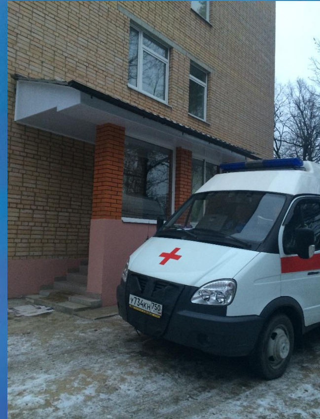
СМП в п.Биокомбинат