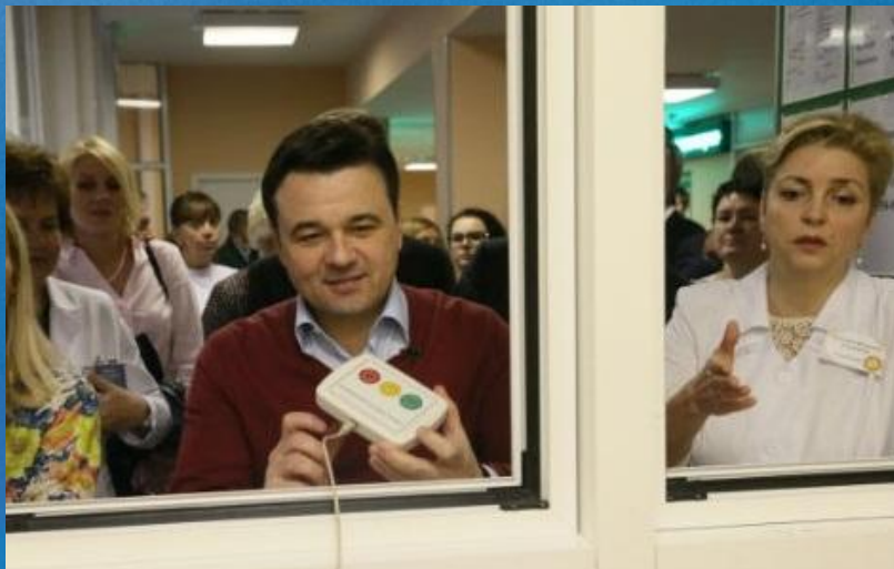
Кнопка оценки качества