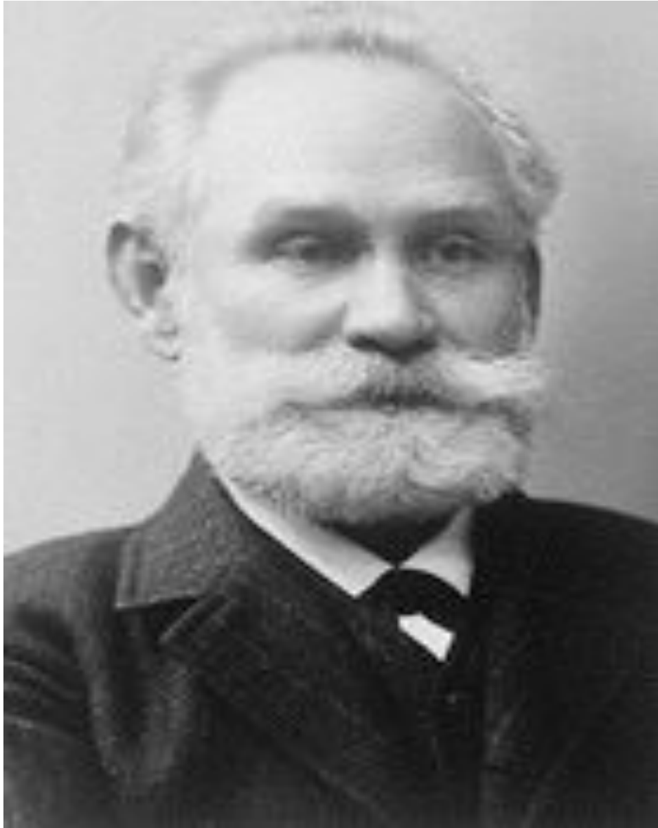
Павлов Иван Петрович (26 сентября 1849г - 27 февраля 1936г)