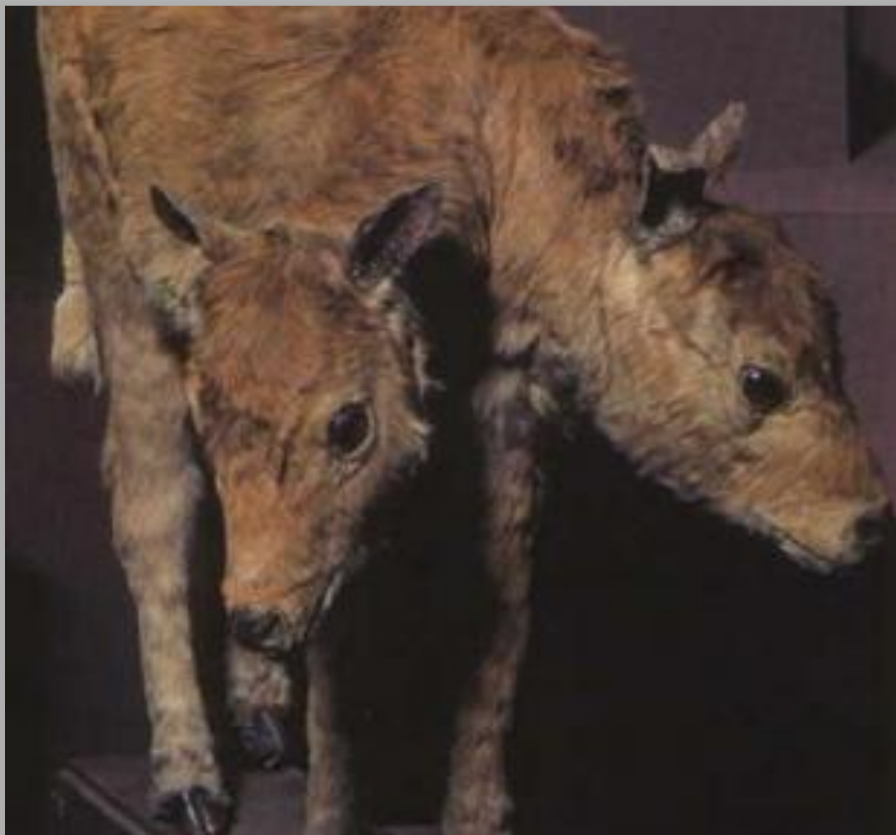
ДВУХГОЛ ОВЫЙ ТЕЛЕНОК