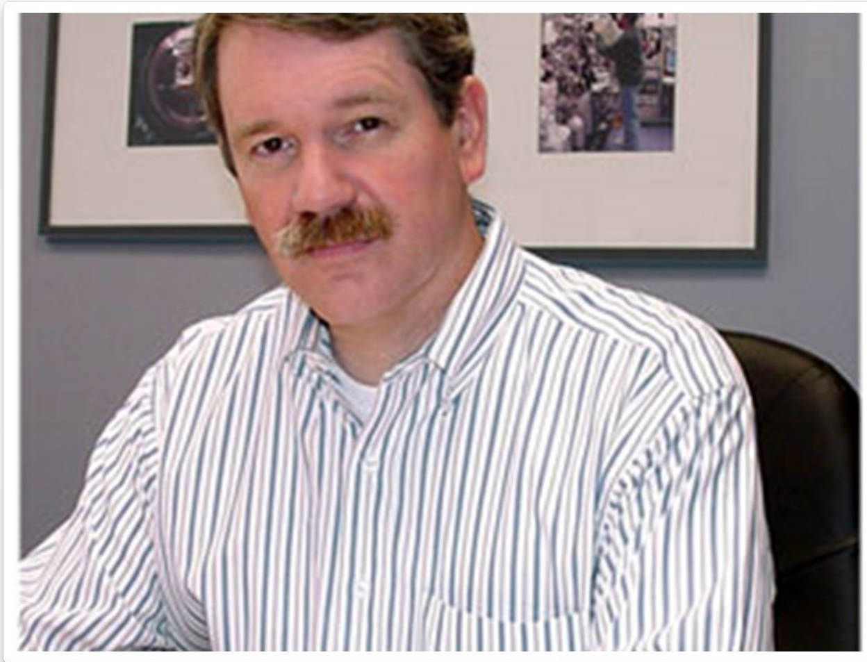
РОБЕРТ ФРЕЙТАС АВТОР ФУНДАМЕНТАЛЬНОГО ТРУДА «НАНОМЕДИЦИНА»