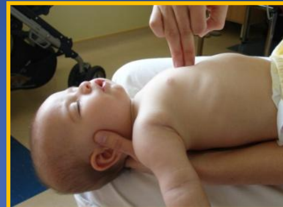
5 вдавливаний в области нижней трети грудины