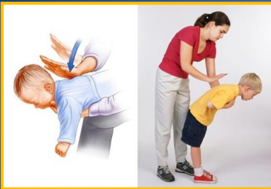
5 ударов между лопатками