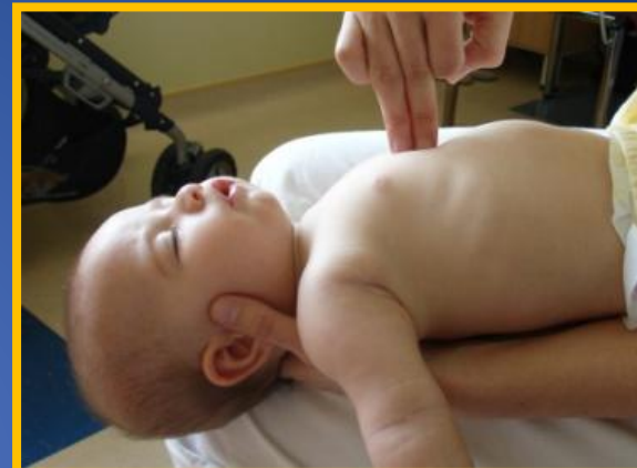
5 вдавливаний в области нижней трети грудины