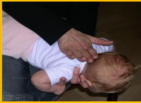
5 ударов по спине