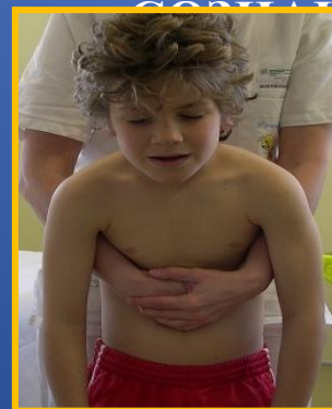
5 абдоминальных вдавливаний

ЕСЛИ ИНОРОДНОЕ ТЕЛО ИЗВЛЕЧЬ НЕ ПОЛУЧАЕТСЯ И НА ЭТОМ ФОНЕ РЕБЁНОК ТЕРЯЕТ СОЗНАНИЕ, СЛЕДУЕТ НАЧИНАТЬ СЕРДЕЧНО – ЛЁГОЧНУЮ РЕАНИМАЦИЮ!!!