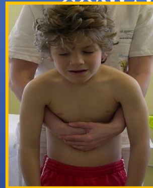
5 абдоминальных вдавлений

ЕСЛИ ИНОРОДНОЕ ТЕЛО ИЗВЛЕЧЬ НЕ ПОЛУЧАЕТСЯ И НА ЭТОМ ФОНЕ РЕБЁНОК ТЕРЯЕТ СОЗНАНИЕ, СЛЕДУЕТ НАЧИНАТЬ СЕРДЕЧНО – ЛЁГОЧНУЮ РЕАНИМАЦИЮ!!!