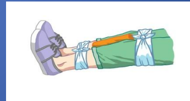
Прибинтовать пострадавшую ногу к здоровой