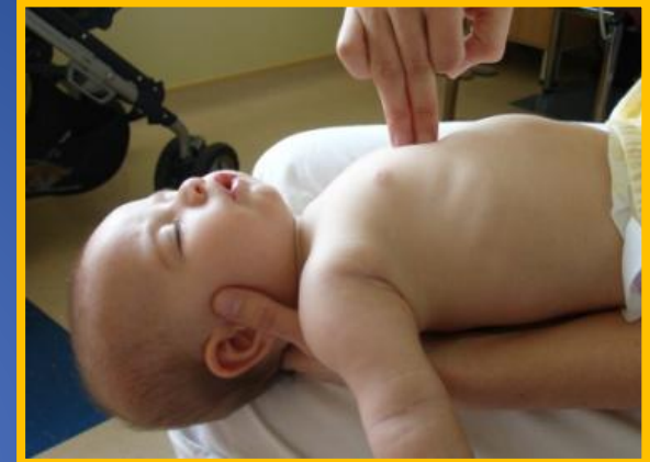
5 вдавливаний в области нижней трети грудины