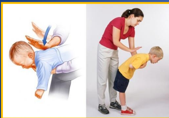
5 ударов между лопатками