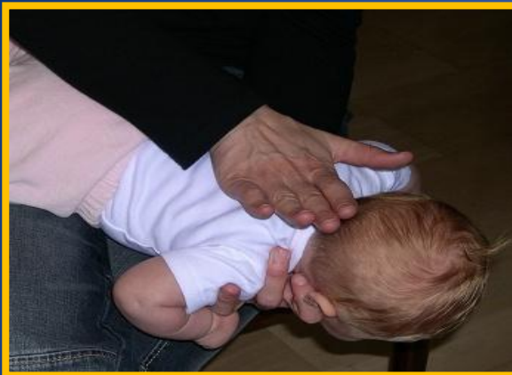
5 ударов по спине