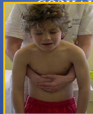
5 абдоминальных вдавливаний

ЕСЛИ ИНОРОДНОЕ ТЕЛО ИЗВЛЕЧЬ НЕ ПОЛУЧАЕТСЯ И НА ЭТОМ ФОНЕ РЕБЁНОК ТЕРЯЕТ СОЗНАНИЕ, СЛЕДУЕТ НАЧИНАТЬ СЕРДЕЧНО – ЛЁГОЧНУЮ РЕАНИМАЦИЮ!!!