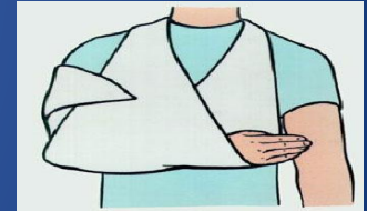
Использовать косынку, прибинтовать повреждённую руку к туловищу