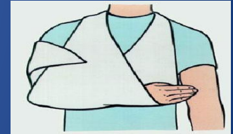
Использовать косынку, прибинтовать повреждённую руку к туловищу