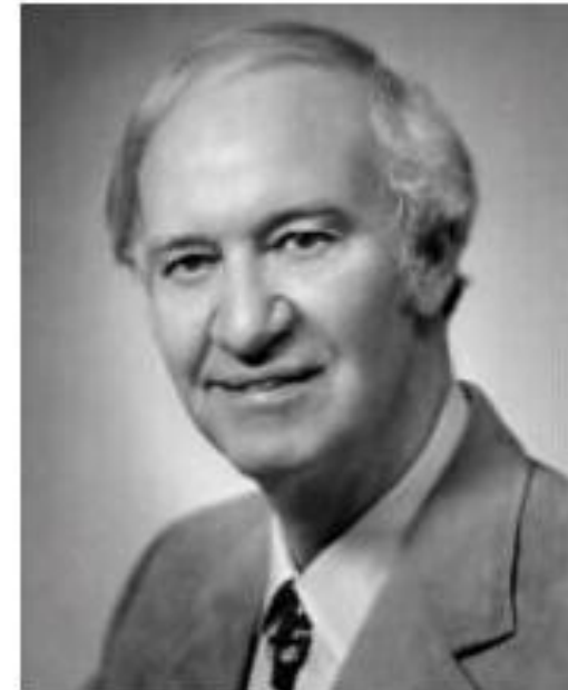
Malcolm Shepherd Knowles (1913 - 1997)