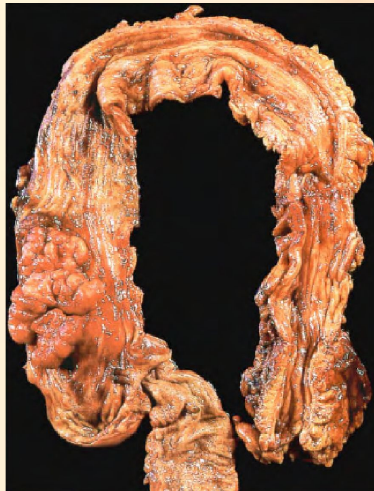
Карцинома слепой кишки