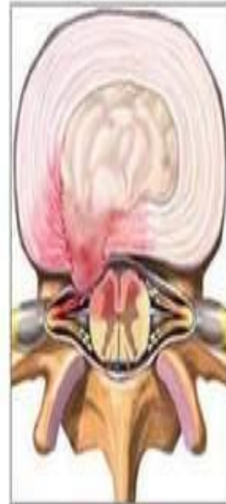
Грыжа межпозвонкового диска