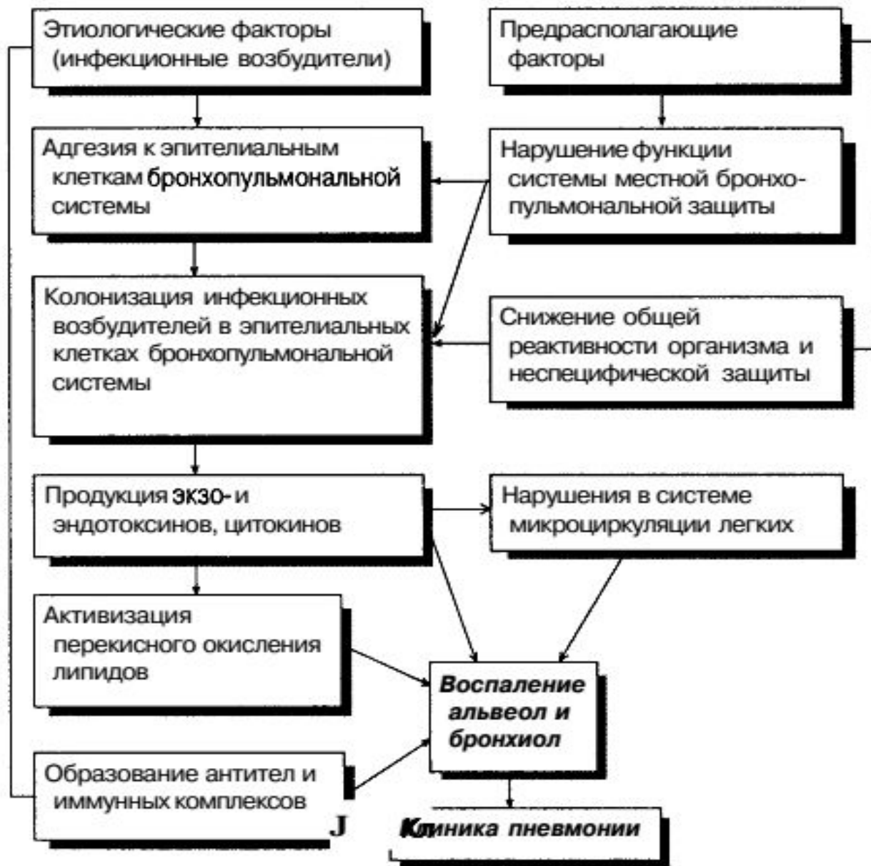
Рис. 18. Схема патогенеза пневмонии (В. И. Маколкин, С. И. Овчаренко, 1999, с изменениями).