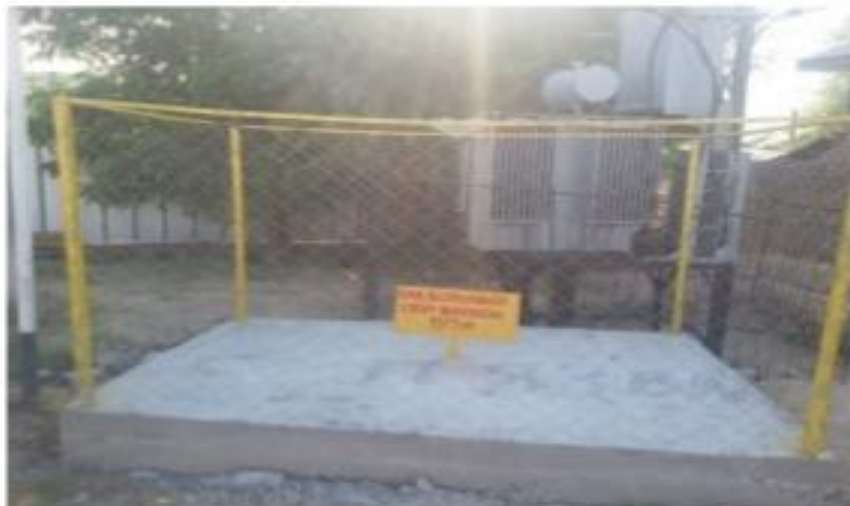
Түркістан қаласы Қазыбек би көшесі №213 телімде орналасқан “Сібір жарасы” ошағы