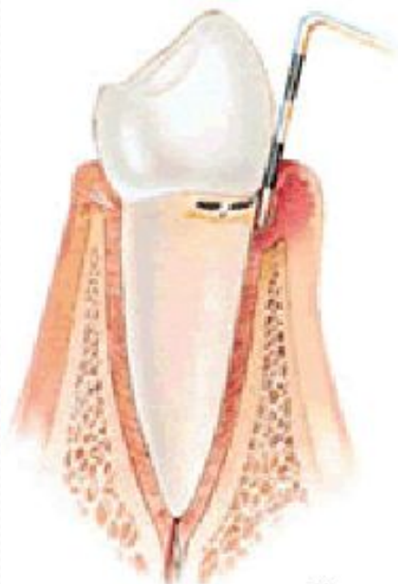
пародонтит легкой степени