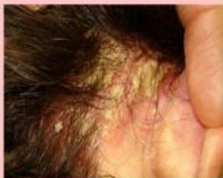
РАЗДРАЖЕНИЕ КОЖИ ГОЛОВЫ