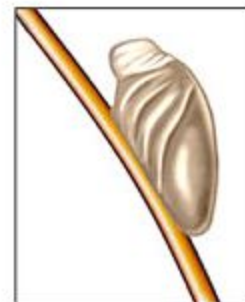
Яйцо вши (гнида) на волосе