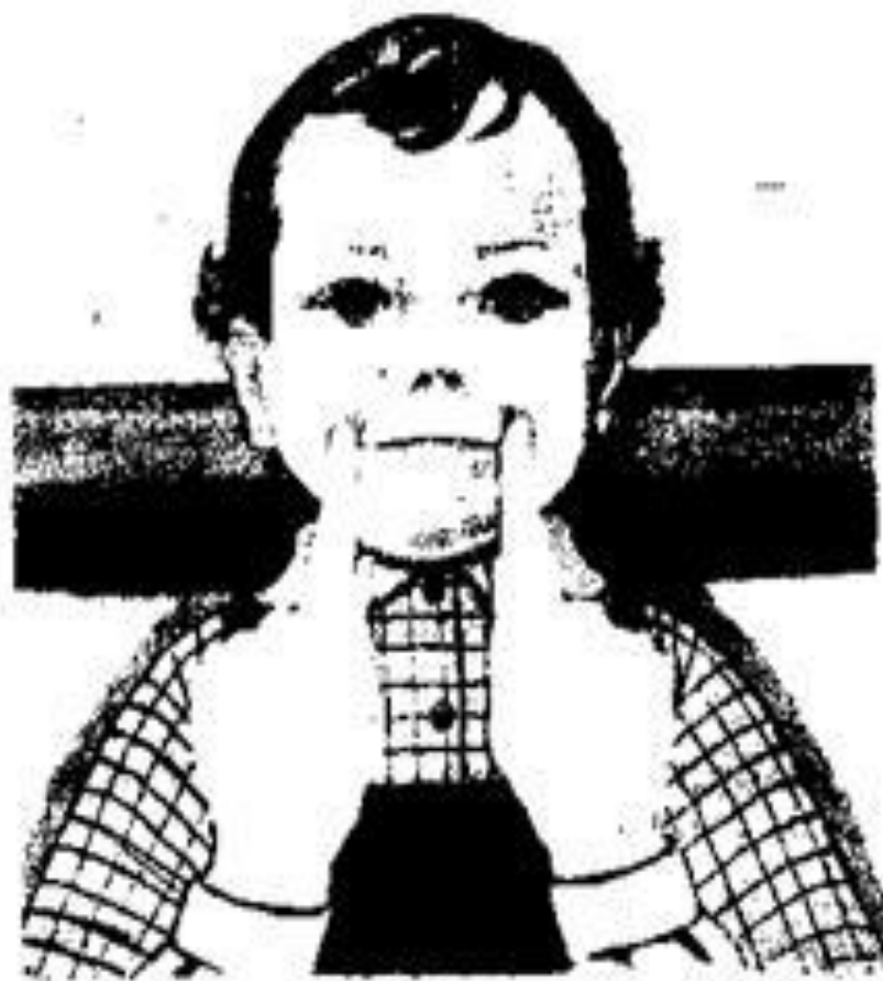
Рис. 52. Растягивание губ в улыбку.