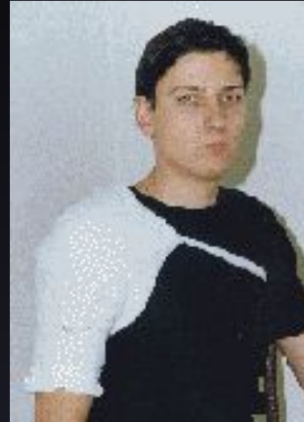
Косыночная повязка на плечевой сустав