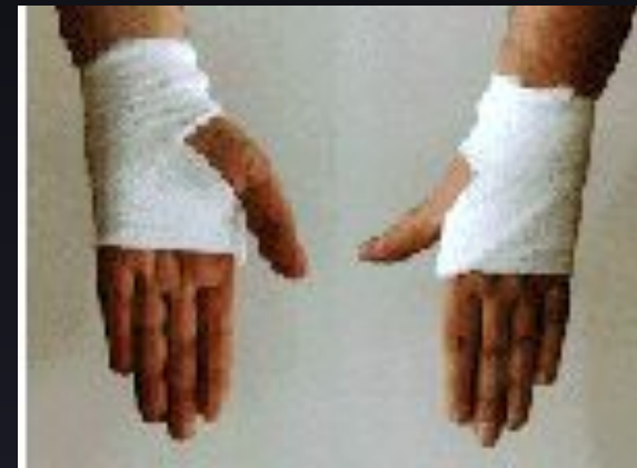
Повязки при ранении кисти