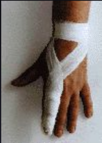
Повязки при ранении пальцев