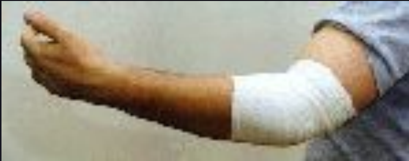
Повязка на коленный и локтевой суставы