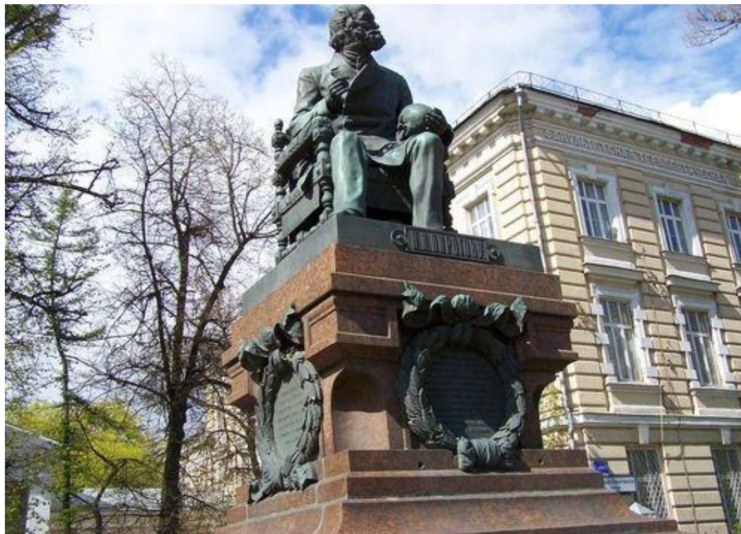
Памятник Н.И.Пирогову в Москве.