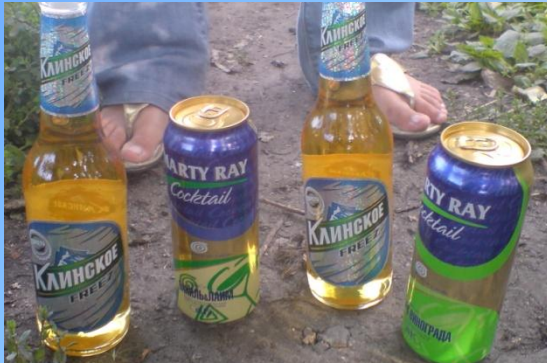
Употребление спиртных напитков