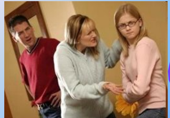
Конфликты с родителями