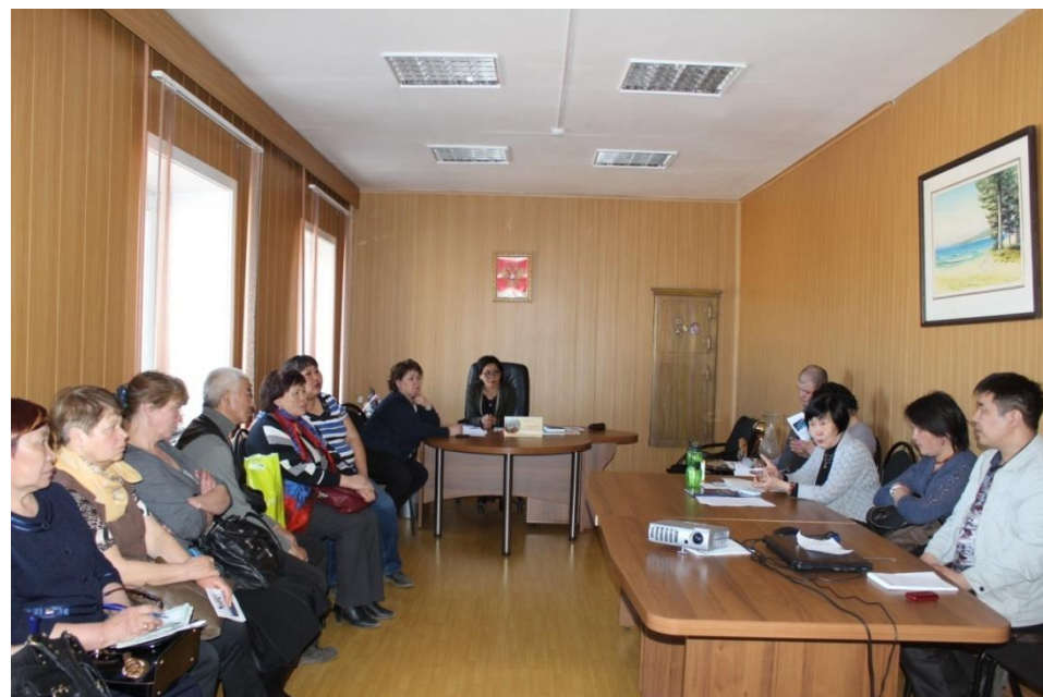
Встреча с врачами Хоринской ЦРБ (16.04.2015г.)