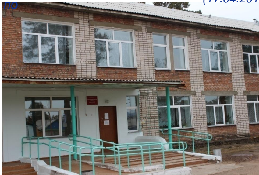
Отделение паллиативной мед.помощи в с.Новокижингинск, которое мы посетили 17.04.2015г.