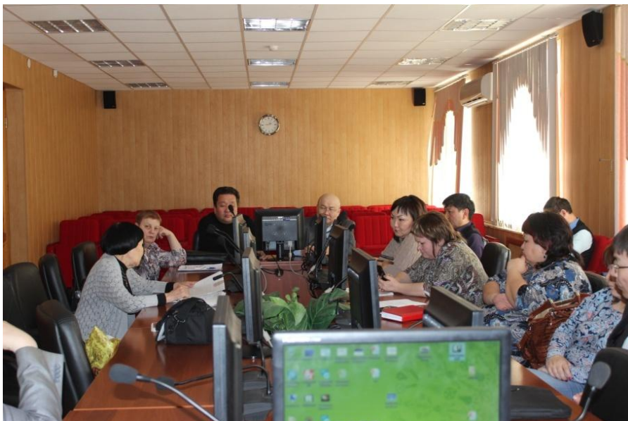
Встреча с врачами Заиграевской ЦРБ (14.04.2015г.)