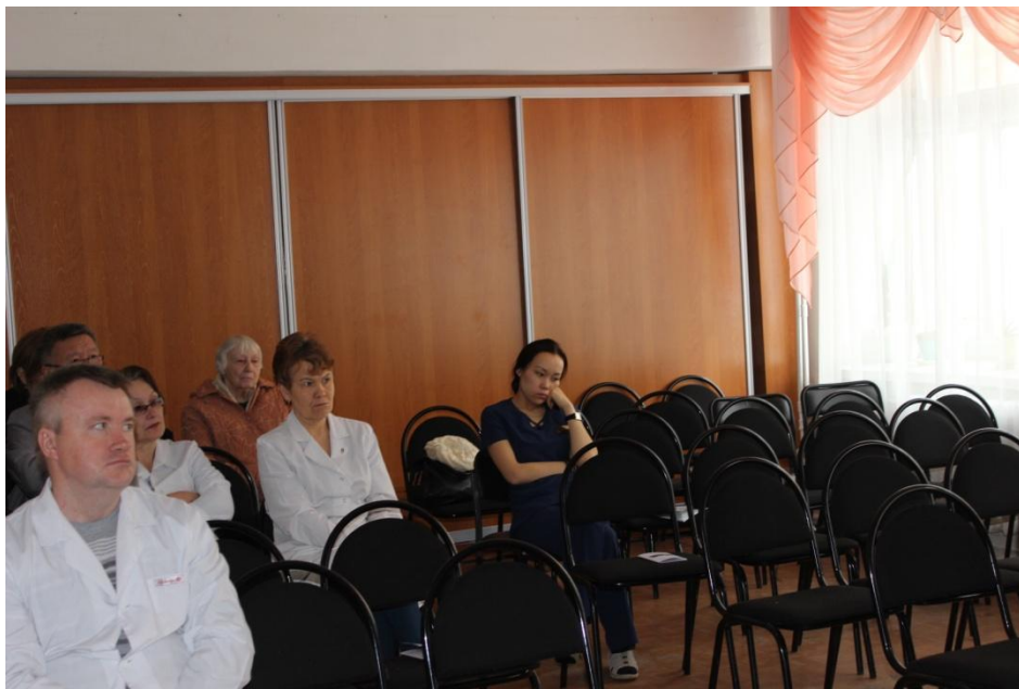
На встрече с врачами НУЗ «Отделенческая больница на ст. Северобайкальск ОАО «РЖД», г. Северобайкальск (23.04.2015г.)