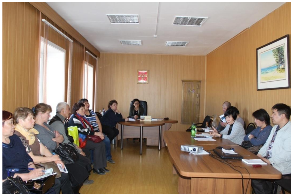
Встреча с врачами Хоринской ЦРБ (16.04.2015г.)