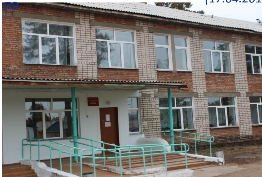
Отделение паллиативной мед.помощи в с.Новокижингинск, которое мы посетили 17.04.2015г.