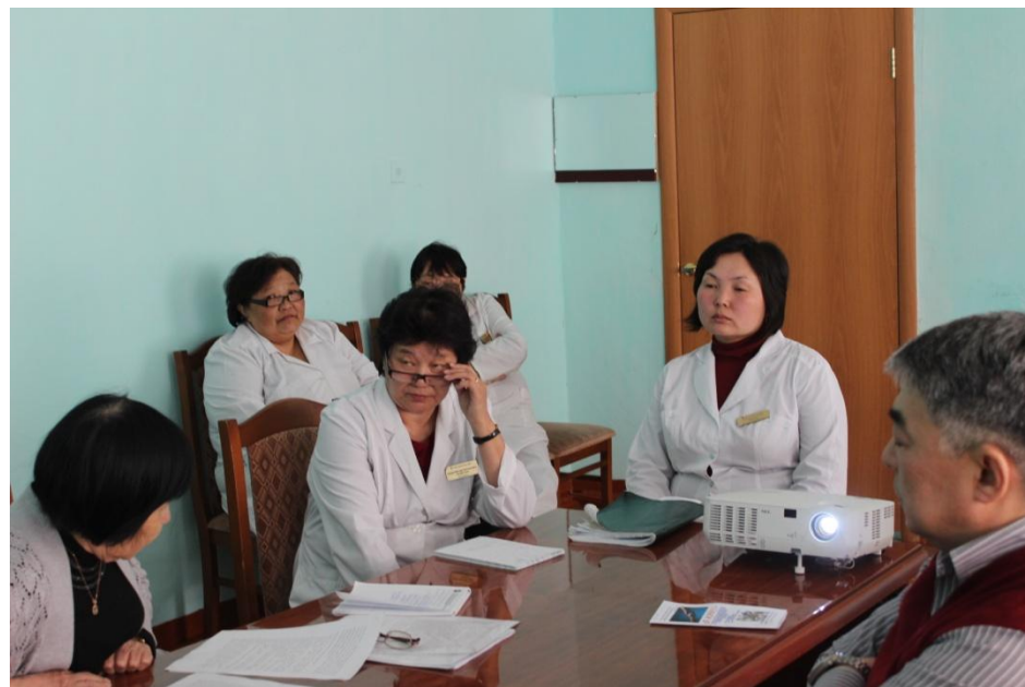
Презентация в Кижингинской ЦРБ (17.04.2015г.)