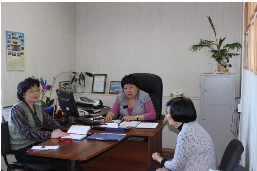
В администрации Хоринского района с начальником отдела по социальной работе (16.04.2015г.)