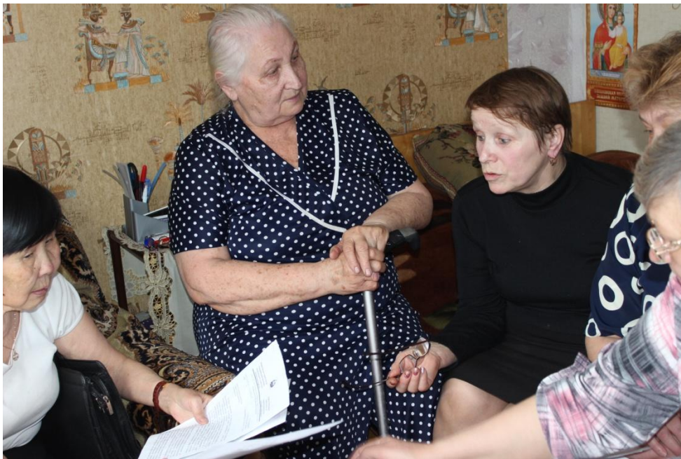
Встреча с жителями г. Северобайкальск по поручению Народного фронта (25.04.2015г.)