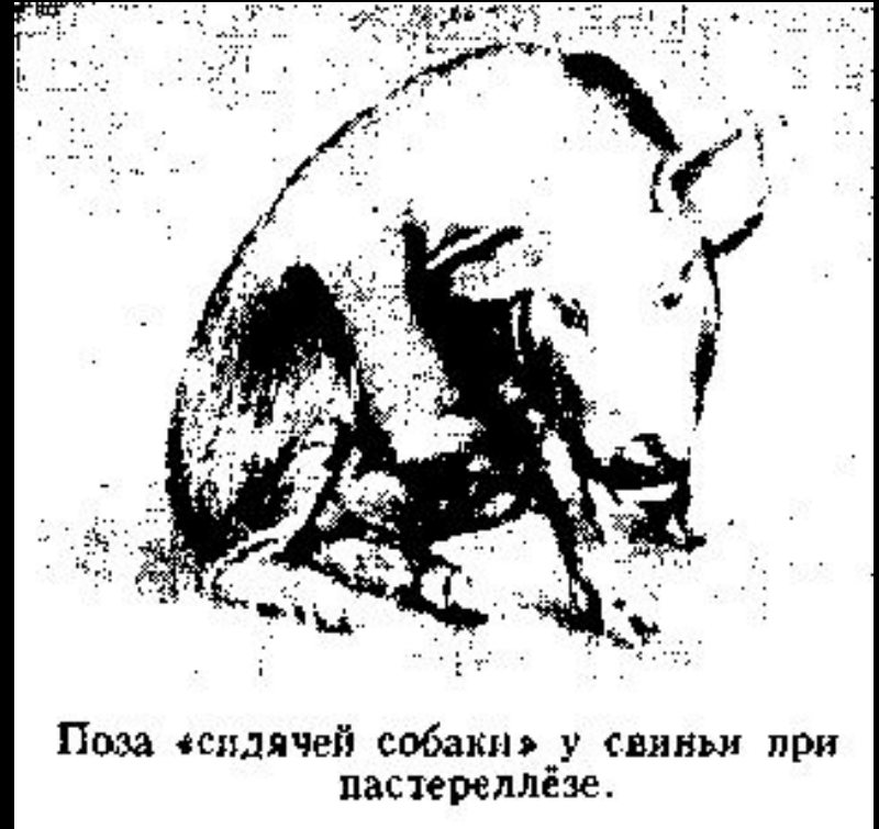
Поза «сидячей собаки» у свиньи при пастереллёзе.