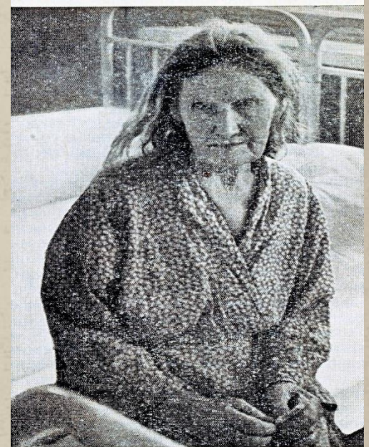
Рис. 24. Инволюционная меланхолия.