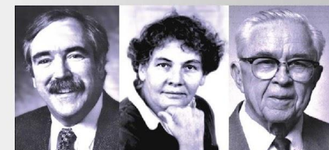
Эрик Вишаус Кристиана Дамман Эвара Люкс

Нобелевская премия за открытие клеточной природы ретровирусных онкогенов