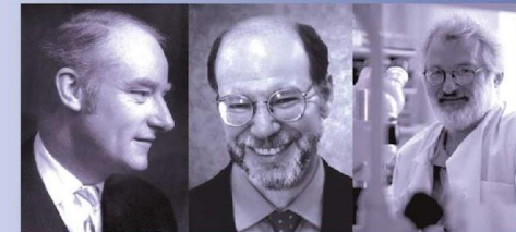
Сидней Бреннер Роберт Хорвиз Джон Салстон

Нобелевская премия за открытие генетического контроля на ранних стадиях эмбрионального развития