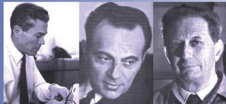
Жак Моно Франсуа Жакоб Андре Львов

Нобелевская премия за расшифровку генетического кода и его роли в синтезе белков