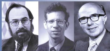
Дэвид Балтимор Хоуард Темин Ренато Дульбекко