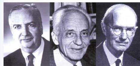
Барух Бенасерраф Жан Доссе Джордж Сидел

Нобелевская премия за открытие генетического контроля синтеза ферментов и вирусов