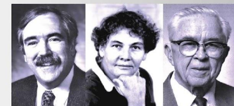
Эрик Вишаус Кристиана Дренх Завара Люкин

Нобелевская премия за открытие клеточной природы ретровирусных онкогенов