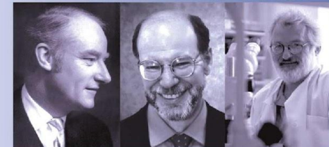
Сидней Бреннер Роберт Хорвиз Джон Салстон

Нобелевская премия за открытие генетического контроля на ранних стадиях эмбрионального развития