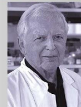
Харальд цур Хаузен

Нобелевская премия за открытие генетического регулирования развития человеческих органов (в т.ч. апоптоз)