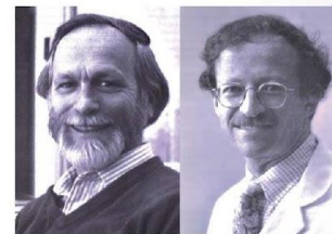
Джон Бишоп Гарольд Вармус

Нобелевская премия за открытие генетически детерминированных структур на клеточной поверхности, регулирующих иммунные реакции