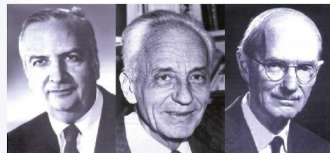
Барух Бенасерраф Жан Доссе Джордж Сидел

Нобелевская премия за открытие генетического контроля синтеза ферментов и вирусов