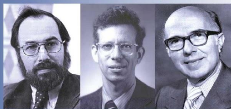
Дэвид Балтимор Хоуард Темин Ренато Дульбекко