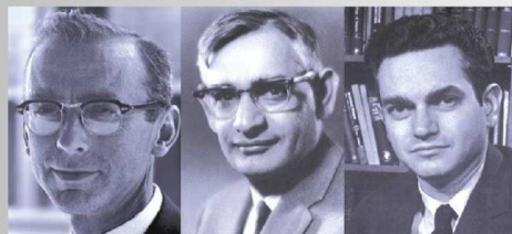
Роберт Холли Хар Корана Маршал Ниренберг

Нобелевская премия за открытие взаимодействия между онкогенными вирусами и генетическим материалом клетки