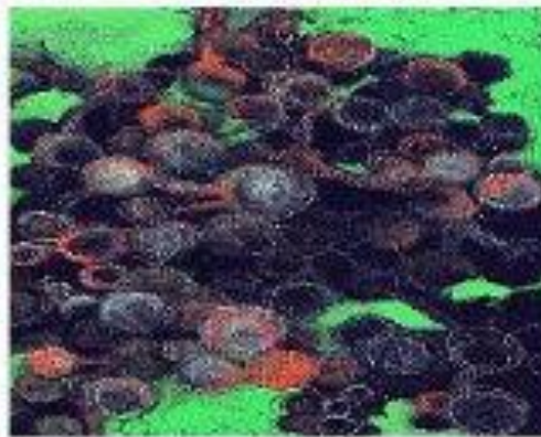
эпидермальный стафилококк S. epidermidis