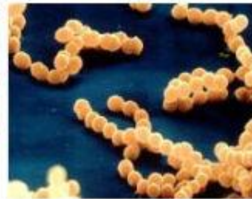
сапрофитный стафилококк S. saprophyticus