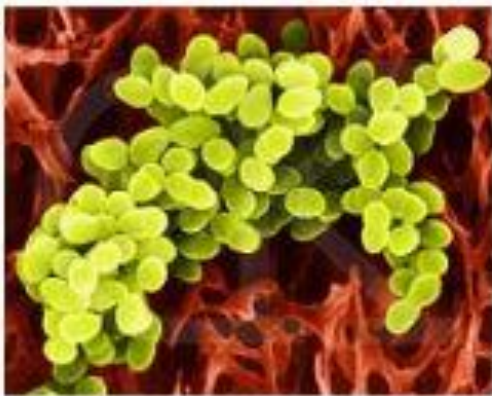
золотистый стафилококк S. aureus

В полости рта, носоглотке и на коже обитает 14 видов стафилококков. Большинство стафилококков абсолютно безвредны: из 14 видов, только 3 вызывают заболевания. Перечислим их: