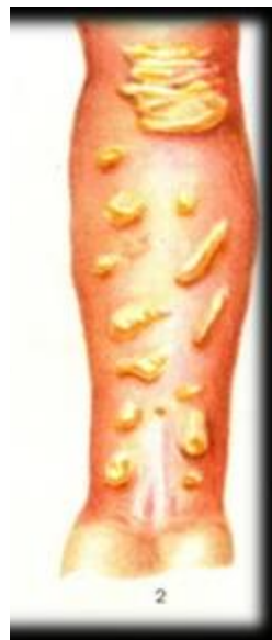
Буллезная рожа предплечья