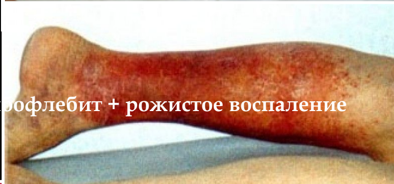
1.Тромбофлебит + рожистое воспаление