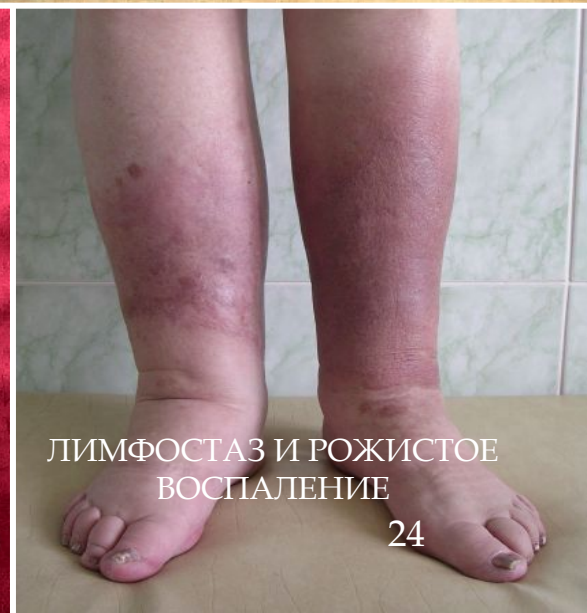
ЛИМФОСТАЗ И РОЖИСТОЕ ВОСПАЛЕНИЕ