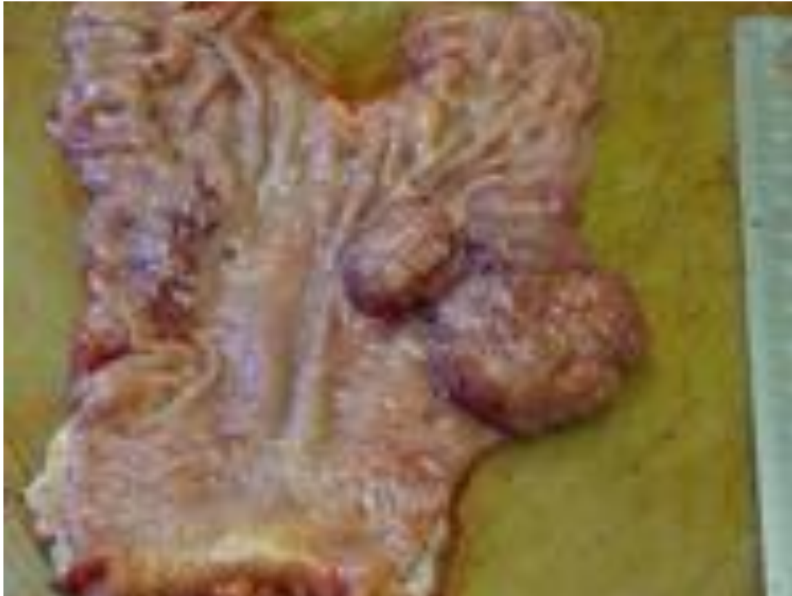
Полиповидный рак желудка