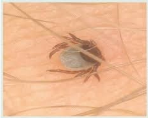
▶ Коростяний кліщ