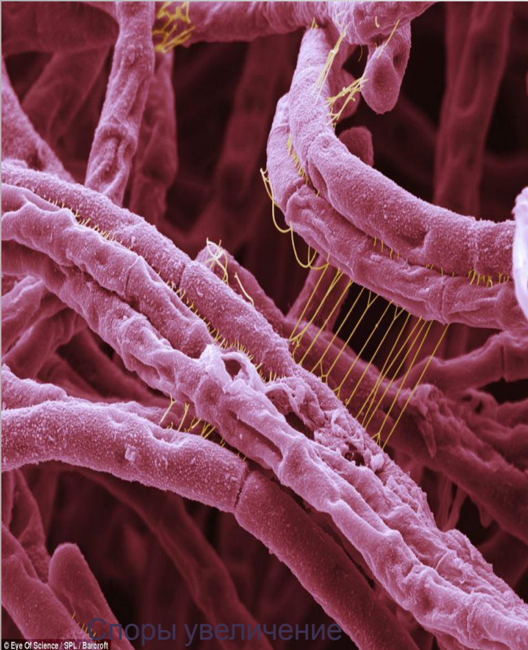
Споры увеличение x18,300