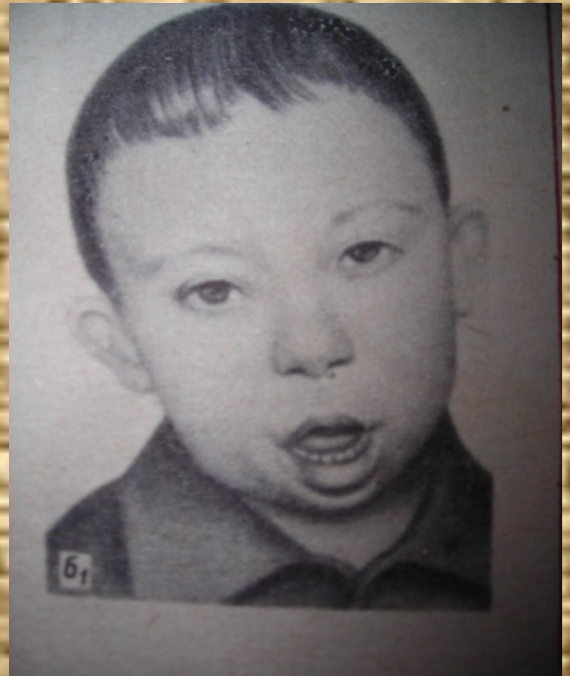
Дети, страдающие болезнью Дауна