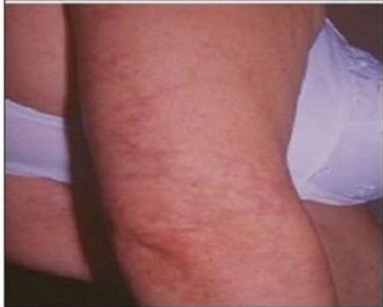
Рис. 1. Сетчатое ливедо у больной с АФС