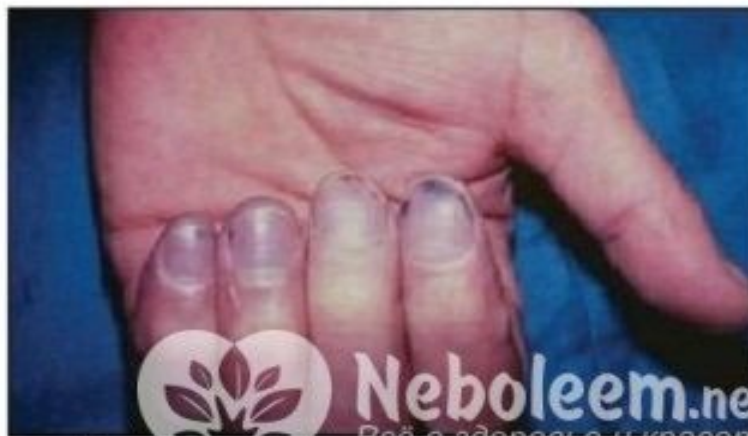
Рис. 3. Подногтевые инфаркты при АФС