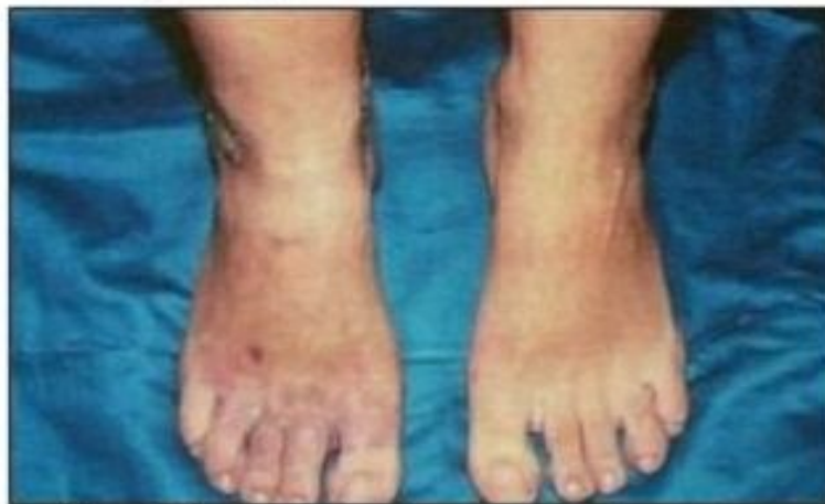
Рис. 2. Хронические язвы правой голени и трофические изменения кожи стопы на почве рецидивирующих тромбозов при АФС