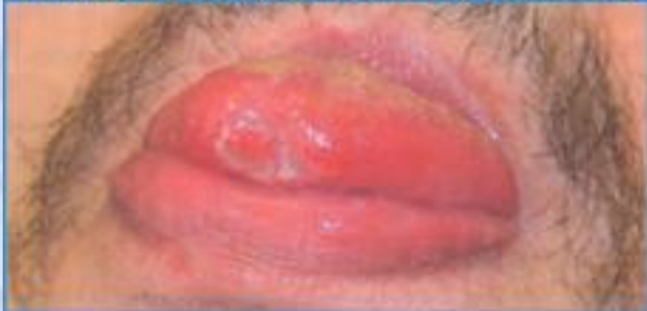
Твердый шанкр (эрозивный) на губе