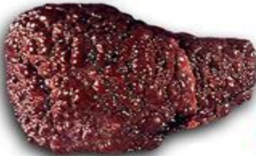
Печень пораженная циррозом