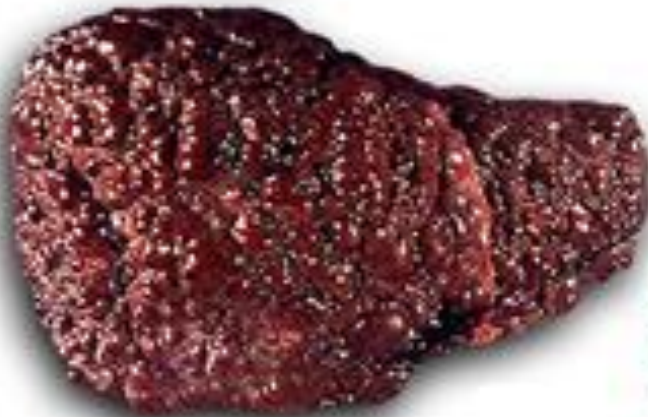
Печень пораженная циррозом