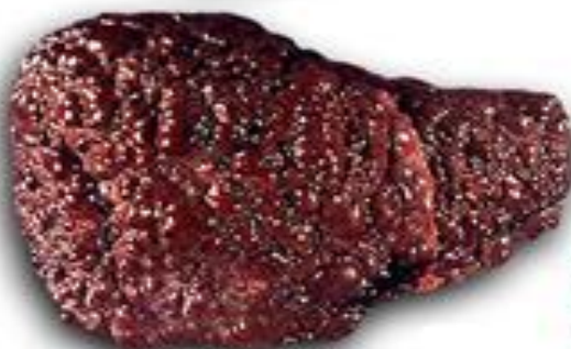
Печень пораженная циррозом