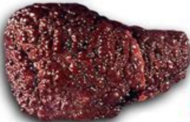
Печень пораженная циррозом