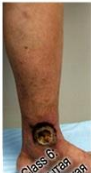
Class 6: Открытая трофическая язва