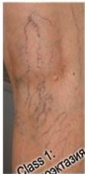
Class 1: Телеангиоэктазия