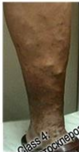
Class 4: Липодерматосклероз Экзема