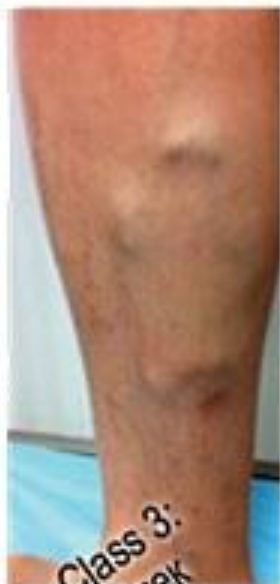
Class 3: Отек