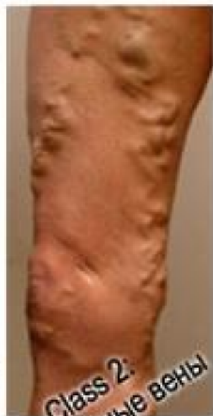
Class 2: Варикозные вены