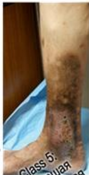
Class 5: Зажившая трофическая язва