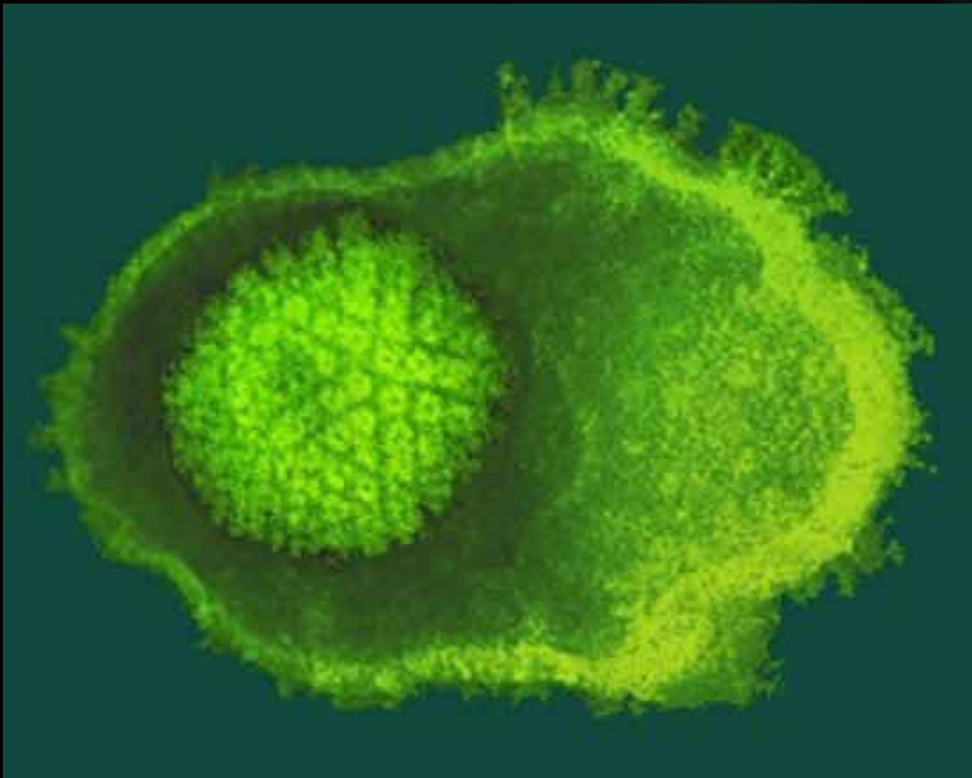
Вирус ветряной оспы