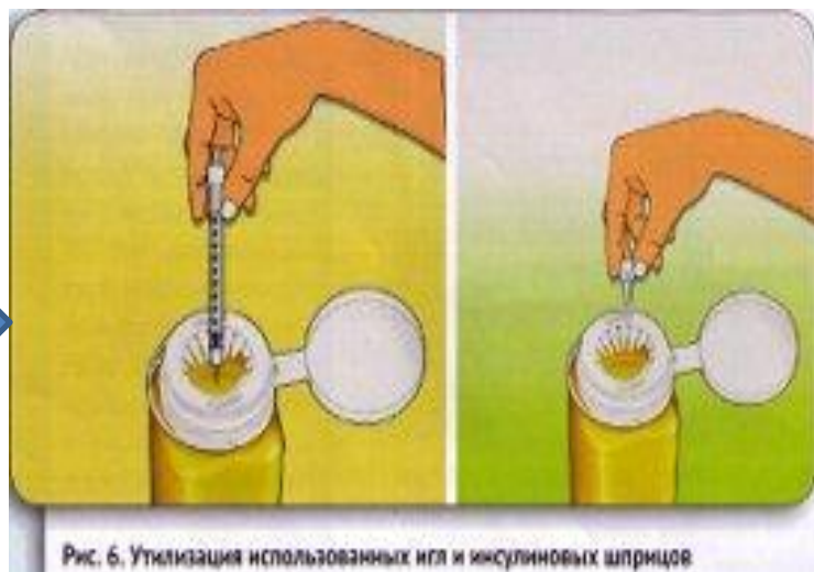
Рис. 6. Утилизация использованных игл и инсулиновых шприцов