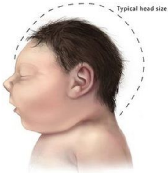
Baby with Microcephaly