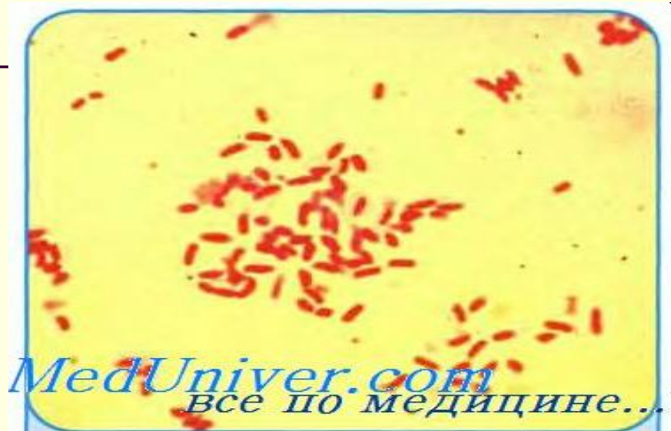
Рис. 3.57. Мазок из чистой культуры H. influenzae . Окраска по Граму.

Грамотрицательные палочки (0,3–0,4 x 1–1,5 мкм), иногда — мелкие кокковидные и плеоморфные, иногда — в форме нитей. Неподвижны. Имеют пили. Некоторые штаммы образуют капсулы. Факультативные анаэробы. Нуждаются в факторах роста X (гематин) и V (никотинамид аденин динуклеотид), поэтому растут на среде со свежей кровью (род Haemophilus , от греч. haima — кровь, philos — любить)