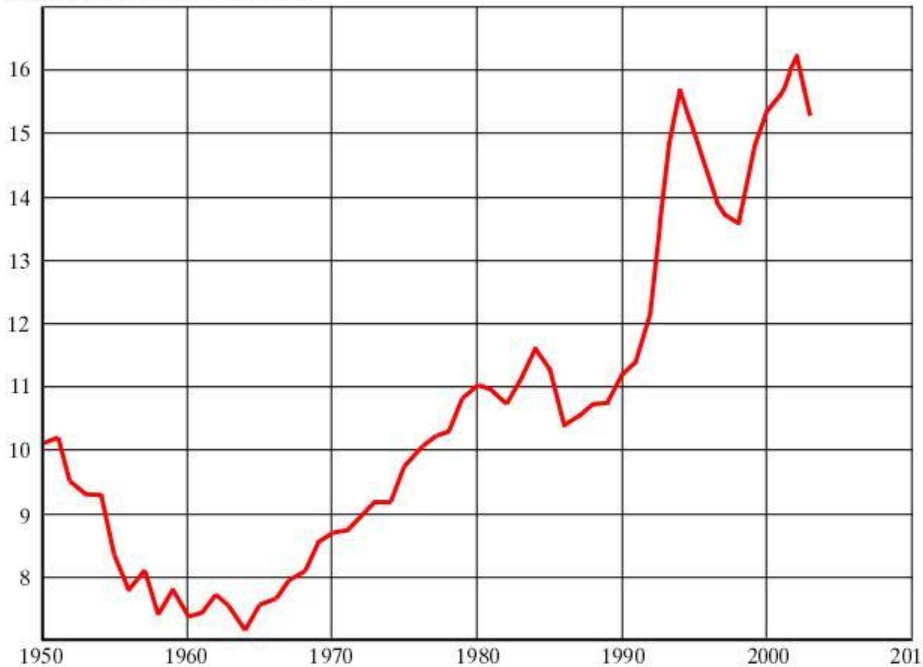
Смертность (на 1000 населения)