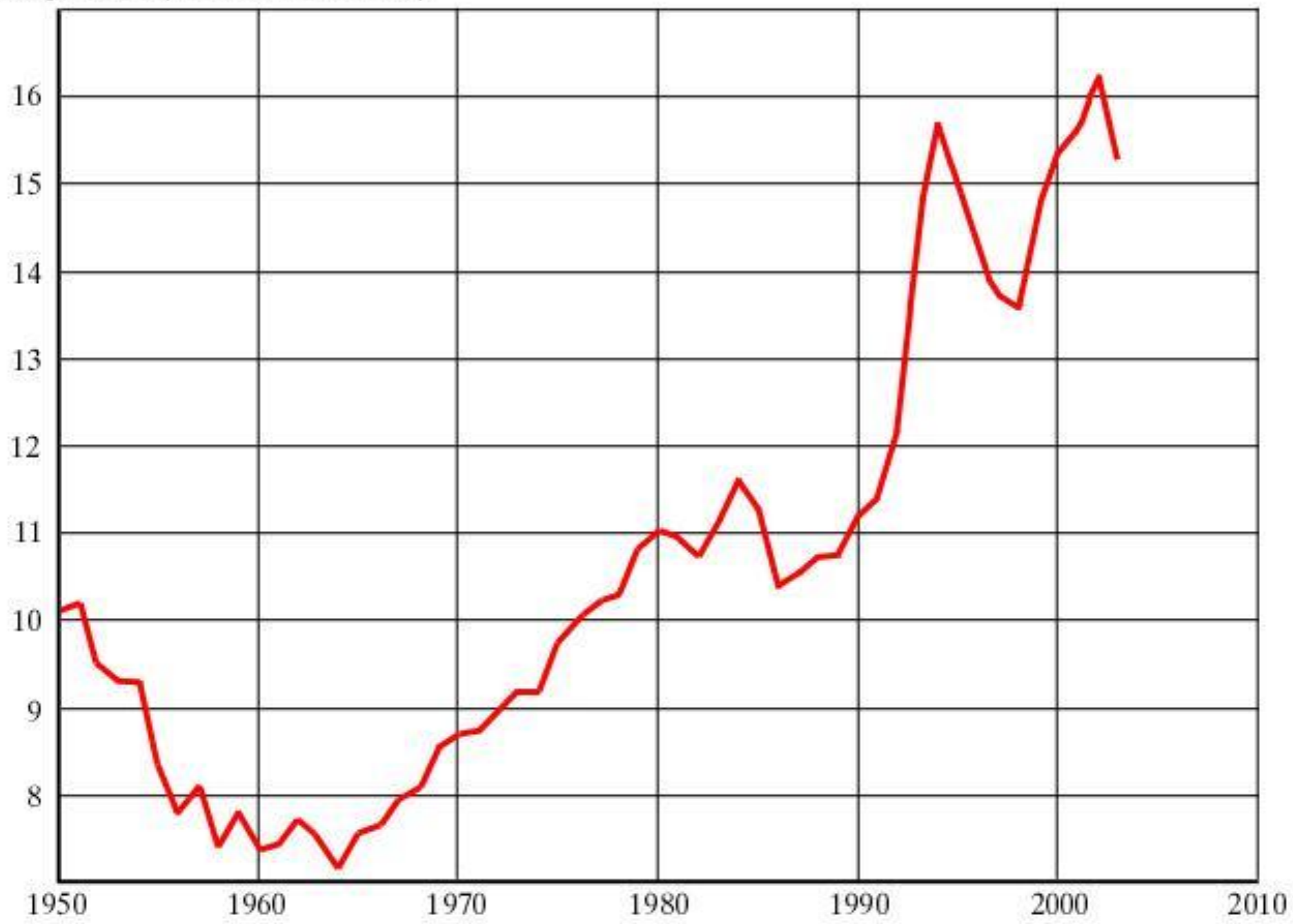
Смертность (на 1000 населения)