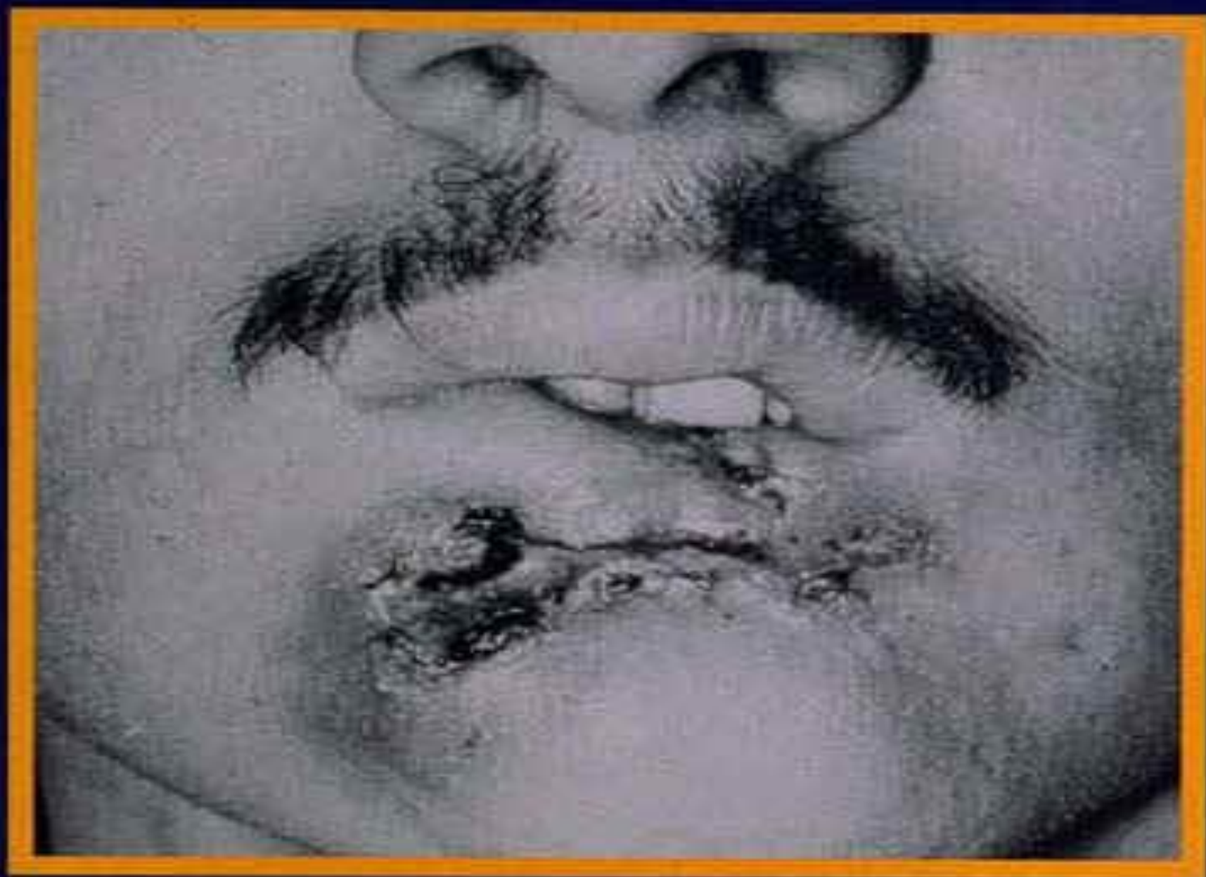
A fatal mouth cancer in a 28-year-old who dipped a can a day for 10 years.