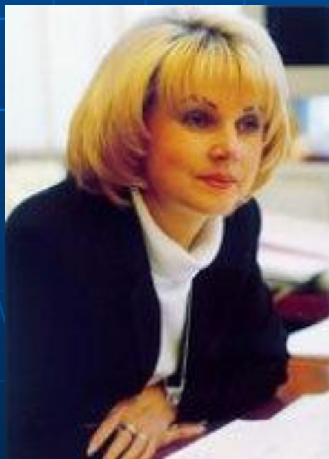
Т. А. Голикова