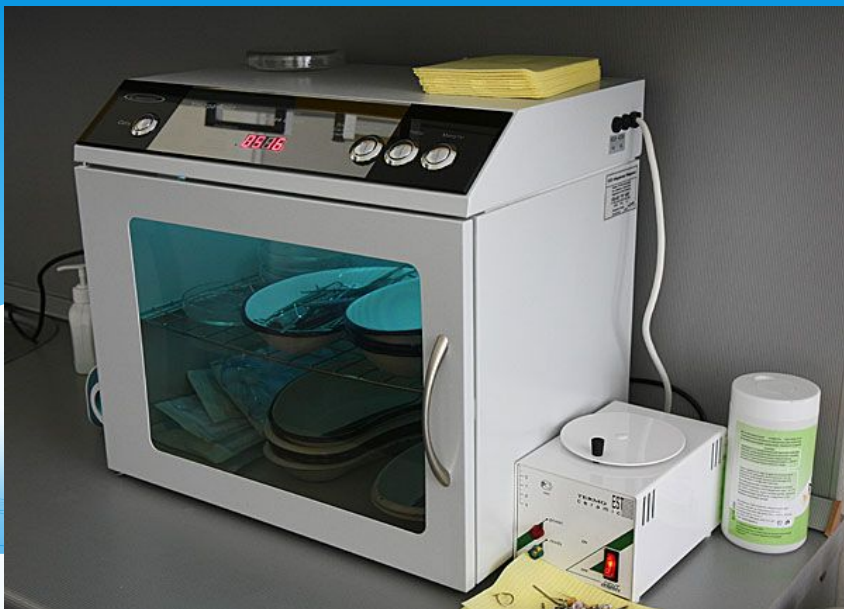
Аппараты для стерилизации