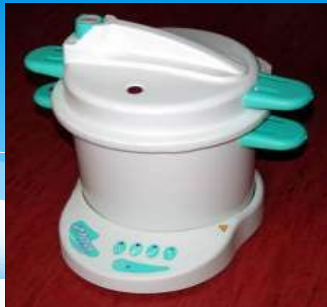
Автоклав Series 2001 класса