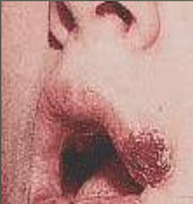
Твердый шанкр на верхней губе человека, больного сифилисом.