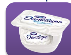
Творожное удовольствие, 130 гр.