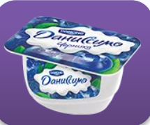
Черника, 130 гр.