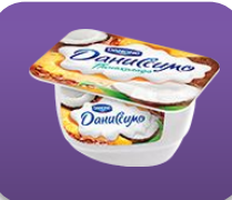
Пинаколада, 130 гр.