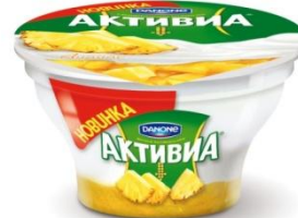
Творожок двухслойный Ананас, 140 гр.

Ничего лишнего: только йогурт, творожок и слой фруктов