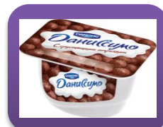
Натуральный, 130 гр.