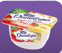
Клубника-банан, 130 гр.