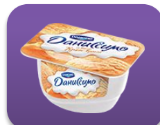
Крем-брюле, 130 гр.