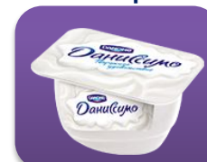
Творожное удовольствие, 130 гр.