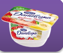
Клубника-банан, 130 гр.