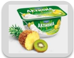
Киви и ананас, 130 гр.