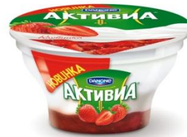
Творожок двухслойный Клубника, 140 гр.