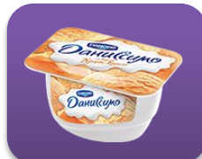
Крем-брюле, 130 гр.