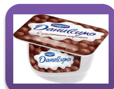
Натуральный, 130 гр.