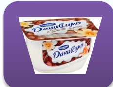
Ванильный, 130 гр.