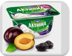
Чернослив, 130 гр.