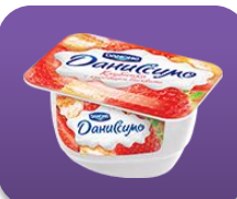
Клубника с кусочками бисквита, 130 гр.