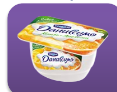
Манго- апельсин, 130 гр.