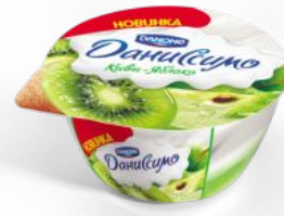
Творожок двухслойный Киви-яблоко, 140 гр.