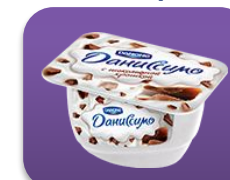
С шоколадной крошкой, 130 гр.