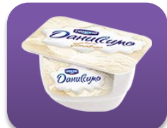
Пломбир, 130 гр.