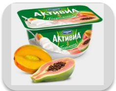
Манго и папайя, 130 гр.