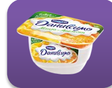
Манго- апельсин, 130 гр.