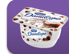
С шоколадной крошкой, 130 гр.