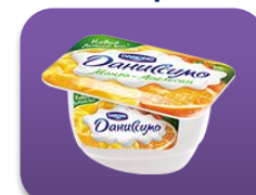
Манго- апельсин, 130 гр.