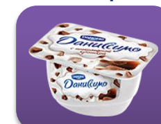
С шоколадной крошкой, 130 гр.