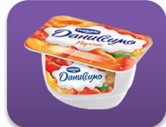
Персик, 130 гр.