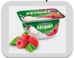
Малина, 130 гр.