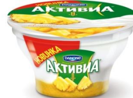
Творожок двухслойный Ананас, 140 гр.

Ничего лишнего: только йогурт, творожок и слой фруктов