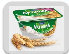
Отруби и злаки, 130 гр.