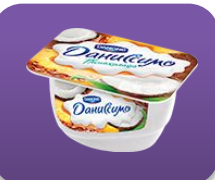
Пинаколада, 130 гр.