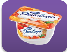
Персик, 130 гр.