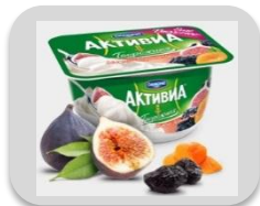
Инфжир-курага- чернослив, 130 гр.