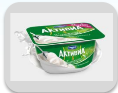
Натуральная, 130 гр.