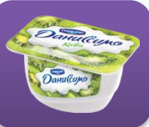
Киви, 130 гр.