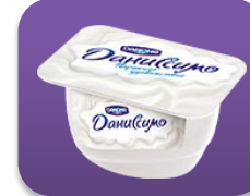
Творожное удовольствие, 130 гр.