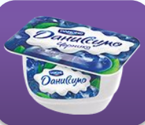
Черника, 130 гр.