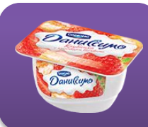
Клубника с кусочками бисквита, 130 гр.