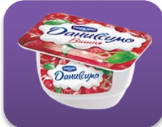
Вишня, 130 гр.