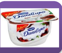
Кокос-шоколад, 130 гр.