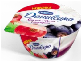
Творожок двухслойный Красная и чёрная смородина, 140 гр.