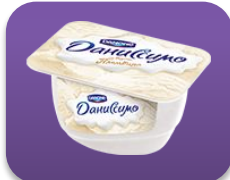
Пломбир, 130 гр.