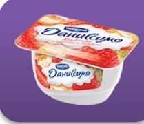
Клубника с кусочками бисквита, 130 гр.