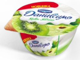
Творожок двухслойный Киви-яблоко, 140 гр.