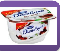
Кокос-шоколад, 130 гр.