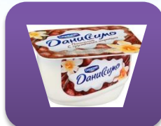
Ванильный, 130 гр.