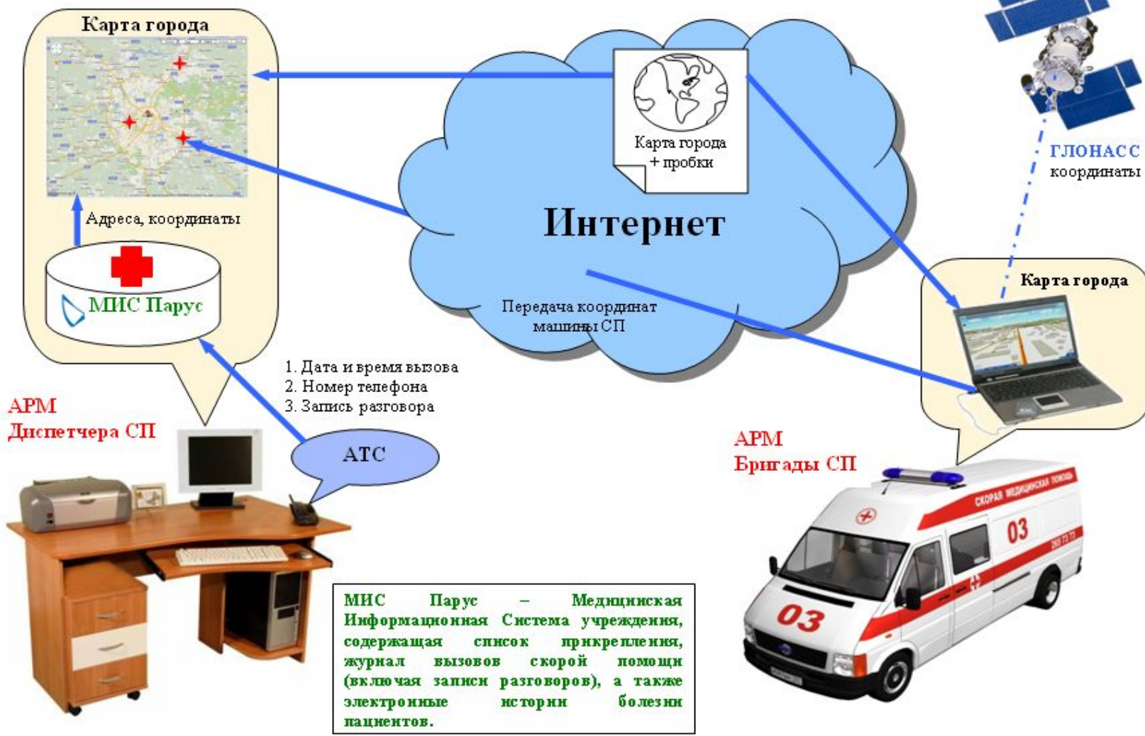
Схема работы информационной системы службы скорой помощи КБ 85

МИС Парус – Медицинская Информационная Система учреждения, содержащая список прикрепления, журнал вызовов скорой помощи (включая записи разговоров), а также электронные истории болезни пациентов.