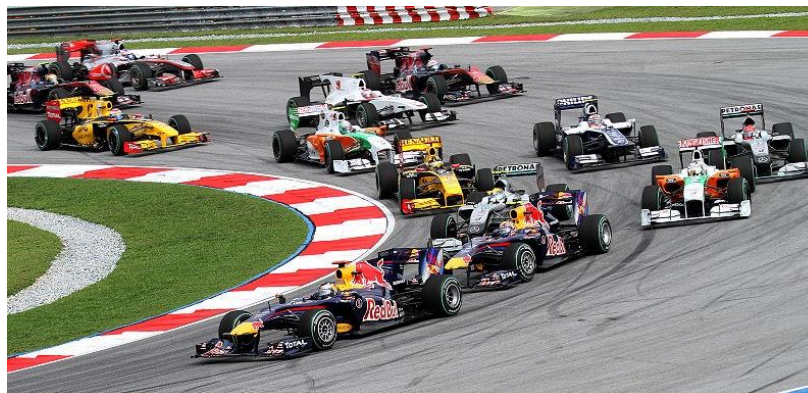
Михаэль Шумахер, экс-пилот «Формулы-1»