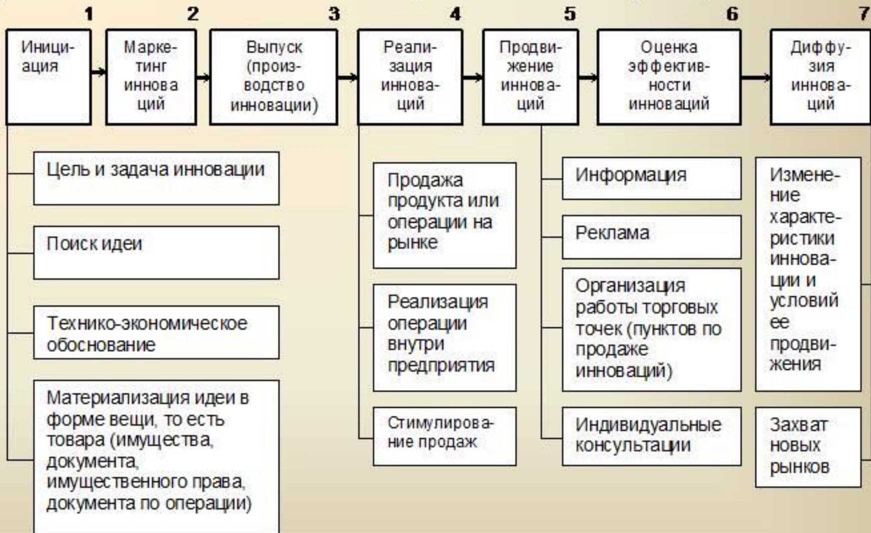
Схема инновационного процесса